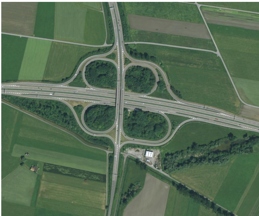
Bild 1: Die A53 von Schmerikon (oben) verschmilzt mit der A3 von Lachen nach Bilten (rechts). Sie führt als Kantonsstrasse weiter nach Reichenburg. Die Waldflächen im Vordergrund markieren den Verlauf der Linth vor dem Bau des Linthkanals.

Im Linthgebiet wird niemand ernsthaft bestreiten, dass seit dem 2. Weltkrieg sowohl die Gesellschaft, die Landschaft als auch die politischen Strukturen eine sich ständig beschleunigende Entwicklung über sich ergehen lassen mussten. Der materielle Wohlstand und die Veränderungen werden weitgehend von Faktoren bestimmt, die regional nur wenig beeinflusst werden können. Um von den globalen Märkten, von der günstigen Energie und vom starken Franken profitieren zu können, muss man sich dem Wachstum verschreiben. Behörden, Unternehmer, Analysten und die Mehrheit der Bevölkerung glauben, den Herausforderungen der Zukunft nur durch ein Noch-Mehr gewachsen zu sein. Die Bemühungen, günstige Rahmenbedingungen für weitere Ansiedlungen zu erzwingen, neue Nutzungen finanziell zu fördern und Hoffnungen zu schüren, wirken oft hektisch und kurzsichtig. Der Verschleiss und die Vereinheitlichung der Landschaft werden in Kauf genommen. Die ständige Erreichbarkeit, die Betriebsamkeit und die Beachtung unzähliger Schlagzeilen und Werbebotschaften gelten für jeden aktiven Menschen als normal. Versicherungen, medizinische Unterstützung, Konsum, Freizeit, Sport, Ferien, Pflege von Traditionen decken alle beliebigen Reste der individuellen Bedürfnisse moderner Einwohner und Nomaden ab.