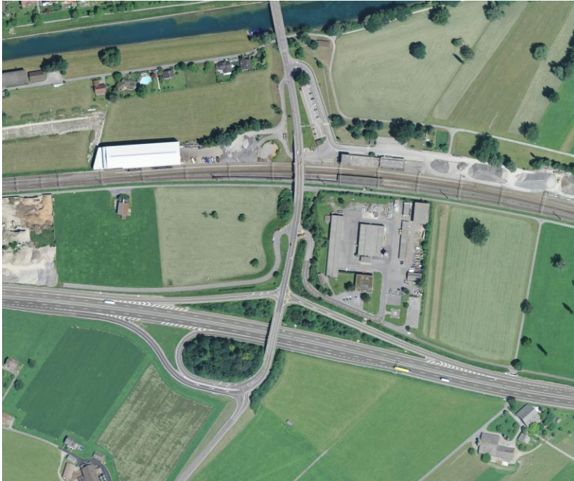
Bild 4: Der Autobahnanschluss in Weesen ist eine Kombination zwischen Kleeblatt (Reichenburg) und Strassenkreuzung (Bilten). Er sorgt für die erstklassige Erschliessung von Glarner Industrieflächen. Sind die Bauten und Anlagen das, was die Touristen in die Ferienregionen lockt?

Luftbild 2010, DOP25, Quelle: Bundesamt für Landestopografie.