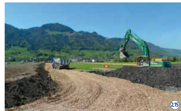
In Reichenburg werden, wie in Benken, rund 13 Hektaren Boden rekultiviert. 215

Am Linthkanal – der längsten Wasserbaustelle der Schweiz – wird noch bis 2013 zwischen Obersee und Walensee saniert und renaturiert. Am Escherkanal sind bereits alle Bauarbeiten abgeschlossen. Der schematische Überblick erklärt die wichtigsten Massnahmen. Weitere Informationen finden Sie unter www.linthwerk.ch .