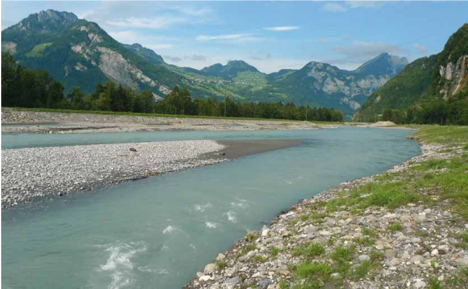
Der sanierte und renaturierte Escherkanal im Chli Gäsitschachen.

Halbzeit für das Projekt «Hochwasserschutz Linth 2000»