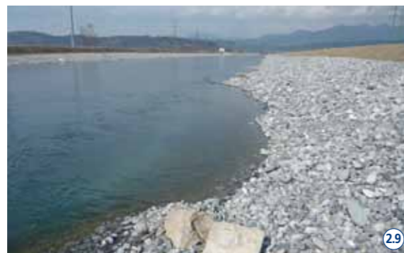
Neue Flachufer am Linthkanal. 29