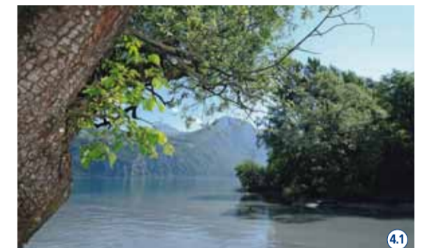
Zwischen Kundertriet und Walensee ist der grösste Teil des artenreichen Walds am Hang zum Waldreservat erklärt worden. 41