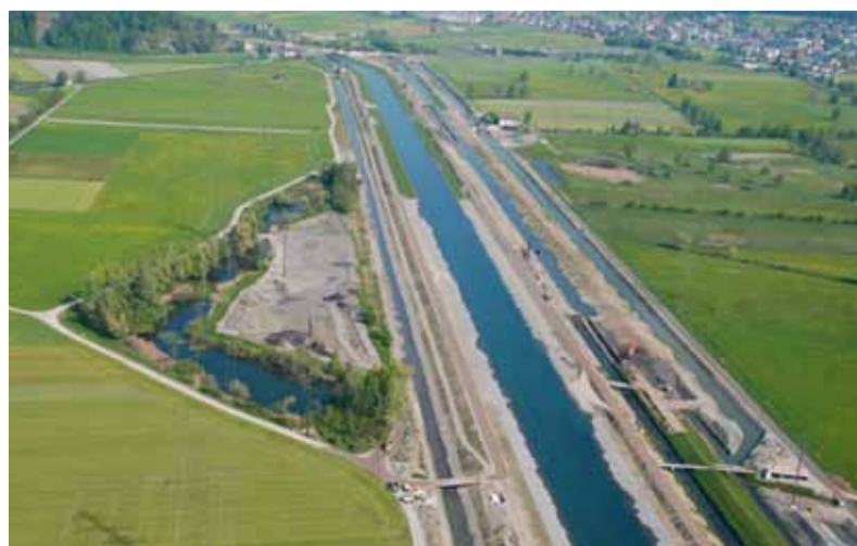
Luftbild 2011, Blickrichtung Grynau, Uznach.

In zwei Rekultivierungsprojekten in der Nähe des Linthkanals konnten rund 200'000 m 3 Erdaushub sinnvoll wiederverwendet werden. Zur Kompensation werden bestehende Schutzgebiete mit Riedflächen um 9 Hektaren vergrössert.