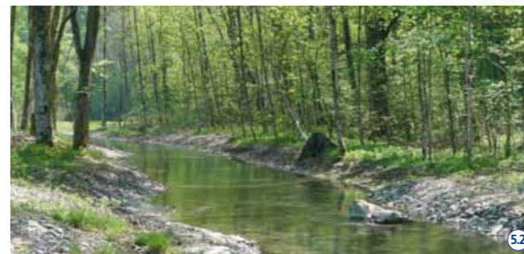
Frühling am neuen Bruggraben. 52