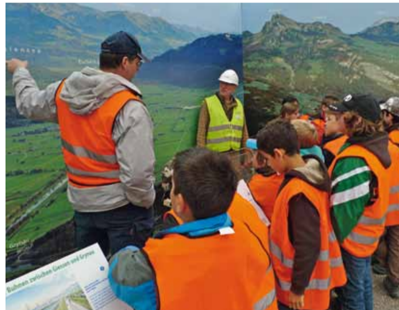
Spannende «Schulstunde» mit Linthwerkführer im Infozentrum.