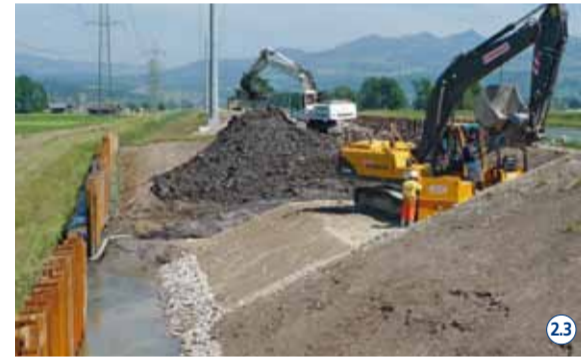
Im Gebiet Giessen wird der Damm aus Platzgründen mit der Variante Materialersatz saniert. 23