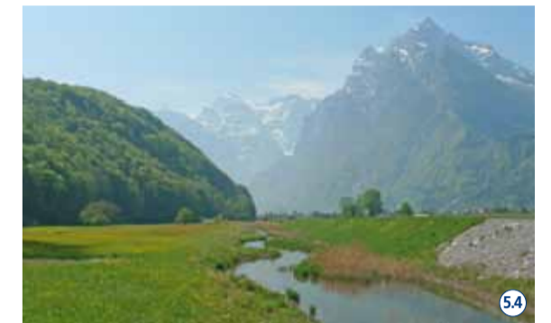
Im Kundertriet grünt es – der Rütelbach wurde schon 2008 renaturiert. 54