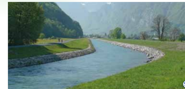
Chupferensteg: Aussendamm verstärkt, Innendamm und Längsverbau im bisherigen Zustand. 51