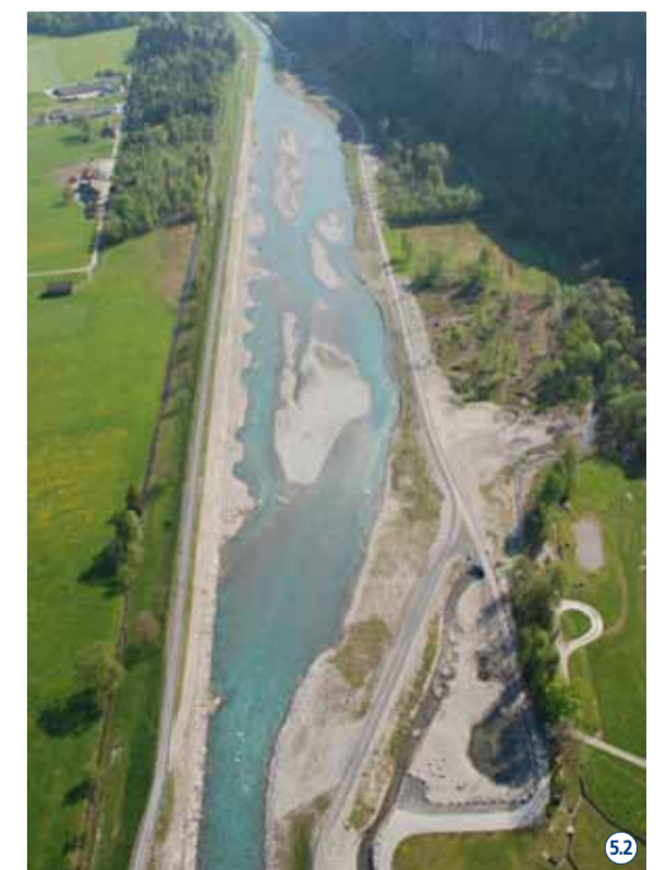
Im Chli Gäsitschachen ist die ursprüngliche Breite der Linth wieder hergestellt. 52