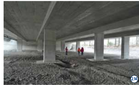
Ein wichtiger Bestandteil der ökologischen Aufwertung des Hänggelgiessens ist die Wildtierunterführung der Nationalstrasse A3 (Projekt ASTRA). 214