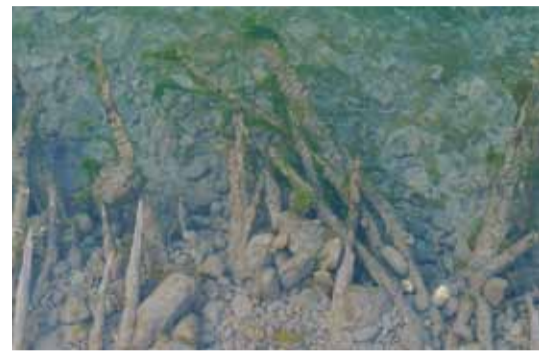
Faschinen aus einer früheren Bauzeit des Linthkanals.

Auf alten Plänen sind Buhnen im Gebiet Landig eingetragen. Vor Beginn der Sanierung des oberen Linthkanals wurde versucht, diese Buhnen zu orten. Nach dem Abtransport der oberen Erdschichten war aber klar: Sie sind nicht mehr vorhanden! Das heisst aber nicht, dass die alten Pläne falsch sind. Wahrscheinlicher ist: Buhnen wurden beim Bau des Linthkanals (zur Absenkung des Walensees) in der Flusssohle eingebaut. Dadurch gewann das Wasser an Geschwindigkeit und Kraft – und vertiefte von selbst die Sohle. Hatte diese die richtige (heutige) Tiefe erreicht, konnten die Buhnen abgebaut und die Steine anderswo verwendet werden, wie das früher üblich war. Anschliessend wurde der Längsverbau mit Faschinen befestigt. Diese