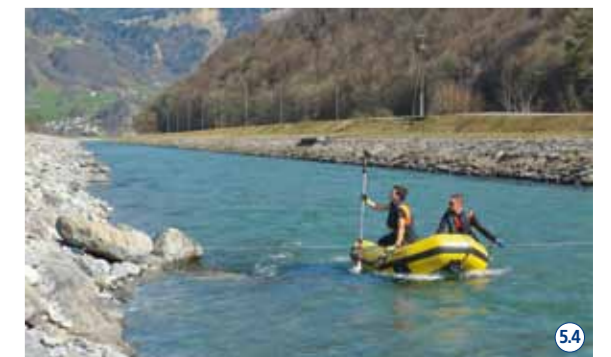
Systematische Vermessung des sanierten Escherkanals: Die Aufnahmen bilden die Grundlage für das nun anlaufende flussbauliche Monitoring. 54