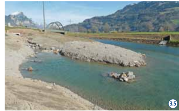
Neugestaltung der Maag-Mündung mit Bucht und Naturufer. 35