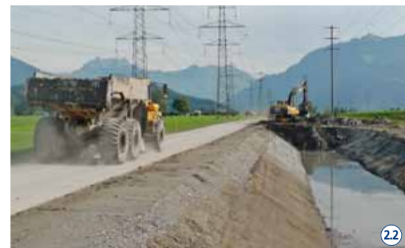
Die neue Nebengrabenstrasse dient als Baupiste. 22