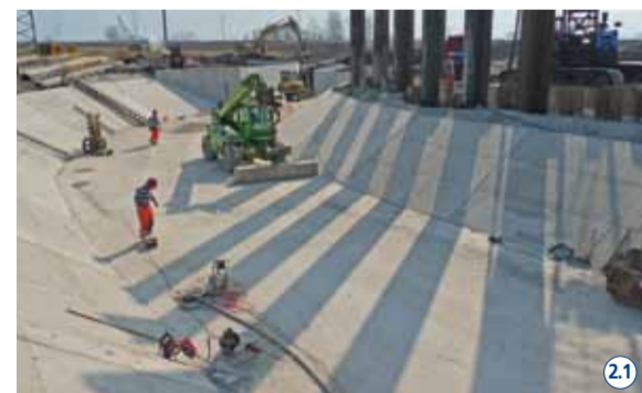
Die Bauarbeiten für den neuen Zulauf zum Pumpwerk Uznach der Linthebene-Melioration sind abgeschlossen. 21