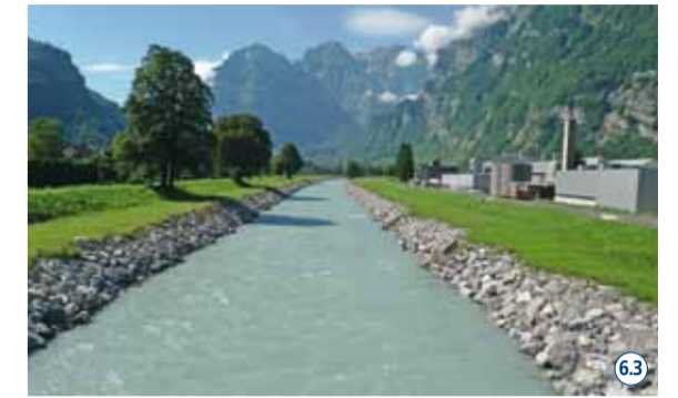
Sanierung Uferlängsverbau am Escherkanal. 63