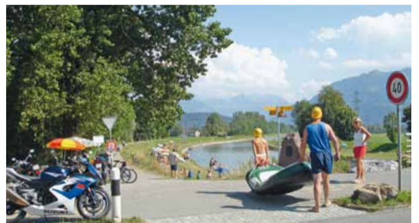
Die Freizeitnutzung rund um das Linthwerk erfordert Regeln.

Für die zukünftige Nutzung des Linthwerks erarbeitet die Linthverwaltung zusammen mit der Fachgruppe Umwelt und mit den betroffenen Gemeinden ein Konzept. Es legt die Standorte und die Gestaltung von Bade-, Rast- und Parkplätzen fest und regelt den Betrieb. Ausserdem unterscheidet man Gebiete, die für die Erholungsnutzung attraktiver gestaltet werden, und andere, wo eine ungestörte Naturentwicklung möglich ist. Die Umsetzung des Konzepts und die Beschilderung vor Ort erfolgen nach Abschluss der Bauarbeiten.